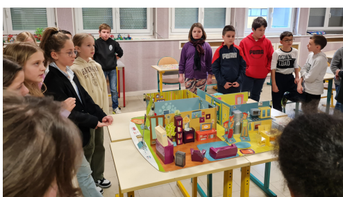
Les élèves de CE1

Certains élèves affirment : « Quand on a ramassé les déchets, c'est plus joli ! »