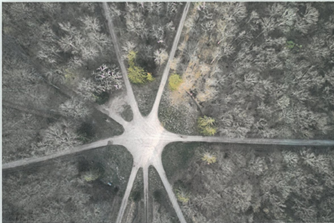
Le rond de la Cave forêt de France, août 2019